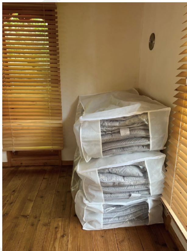
1階敷布団 収納状況