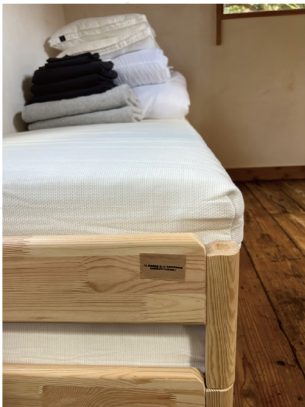
ロフトシングルベッド 収納状況