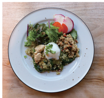
green pesto rice