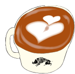
SOY LATTE ソイラテ 510