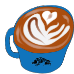
CAFE LATTE カフェラテ 510