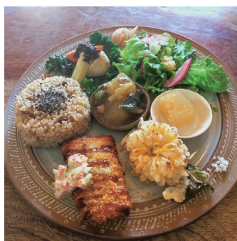
日替わり雑穀プレート