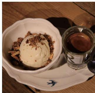
ココナッツアイスの アフオガード 495

SET DRINK + ¥308 // オーガニックコーヒー // オーガニックティー // 三年番茶 // 豆乳