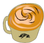
CARAMEL LATTE キャラメルラテ 561