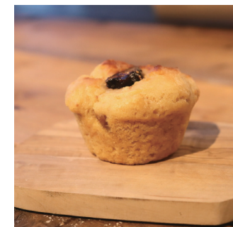
いちじくの米粉マフィン 540