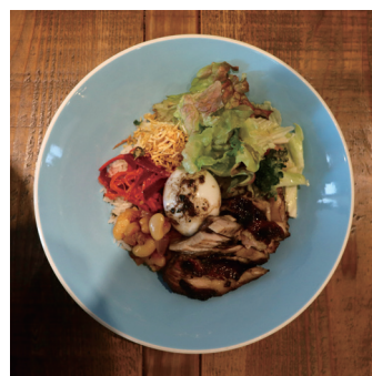
jamaican rice bowl