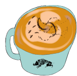
CHOCOLATE LATTE チョコレートラテ 561