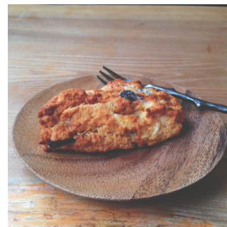
ブルーベリースコーン 438

数種類のスパイスをたっぷり加えたベイクドチーズケーキ。滑らかな口溶け後のキリッと香り立つスパイスの余韻をお楽しみください。