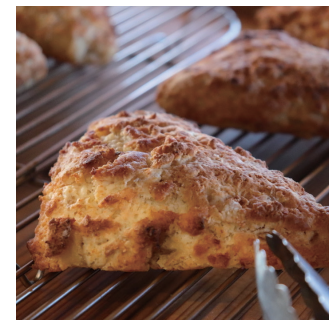
ジンジャースコーン 330