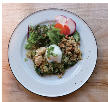
green pesto rice