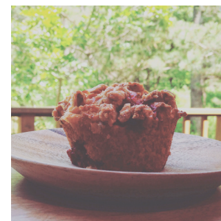
ラズベリーマフィン 489