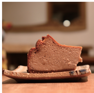
スパイスチーズケーキ 605

数種類のスパイスをたっぷり加えたベイクドチーズケーキ。滑らかな口溶け後のキリッと香り立つスパイスの余韻をお楽しみください。